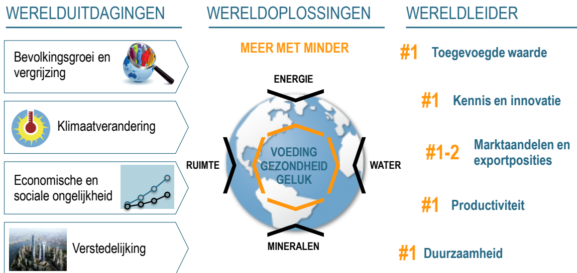
Figuur 1: Wereldleider als bron van duurzame oplossingen voor meer voedselzekerheid en voedselveiligheid, gezondheid en geluk